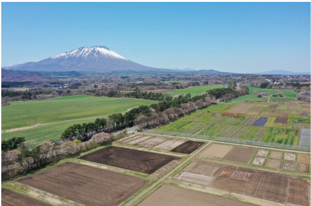
春の滝沢農場（並木の右側）

当日の体温が37.5℃以上の場合、または体調がすぐれない場合、参加をご遠慮ください。また、来場時のマスク着用、手指消毒にご協力をお願いいたします。